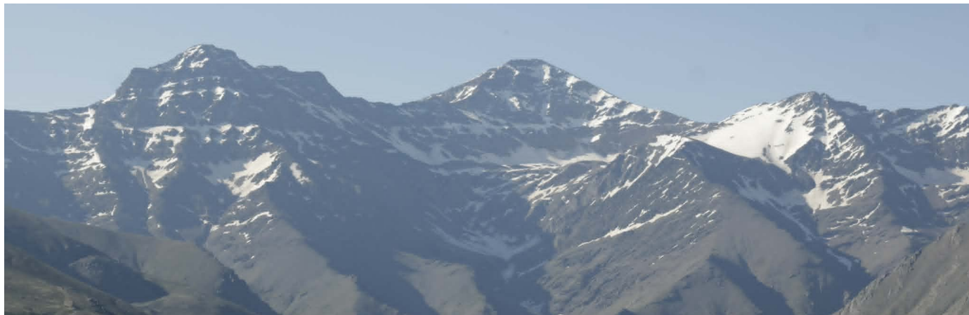
Vertiente norte 1-6-26