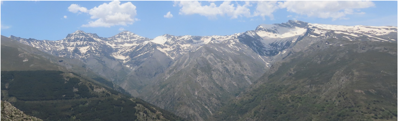
Vertiente norte de la Alcazaba al Veleta 26-5-26