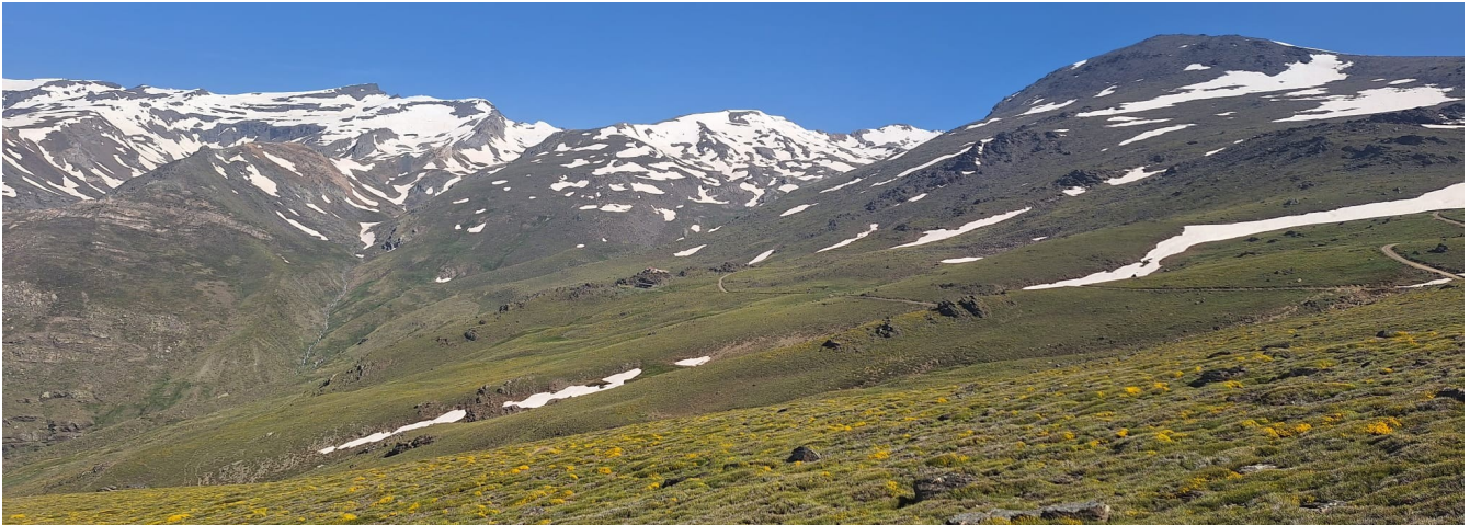
Vertiente sur del Veleta al Mulhacén 26-5-26