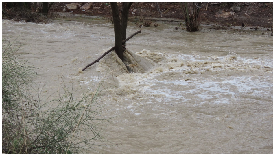
Ríos y arroyos con mucho caudal a causa del deshielo, mucha precaución

Información sobre el riesgo de aludes en el siguiente enlace (no oficial):