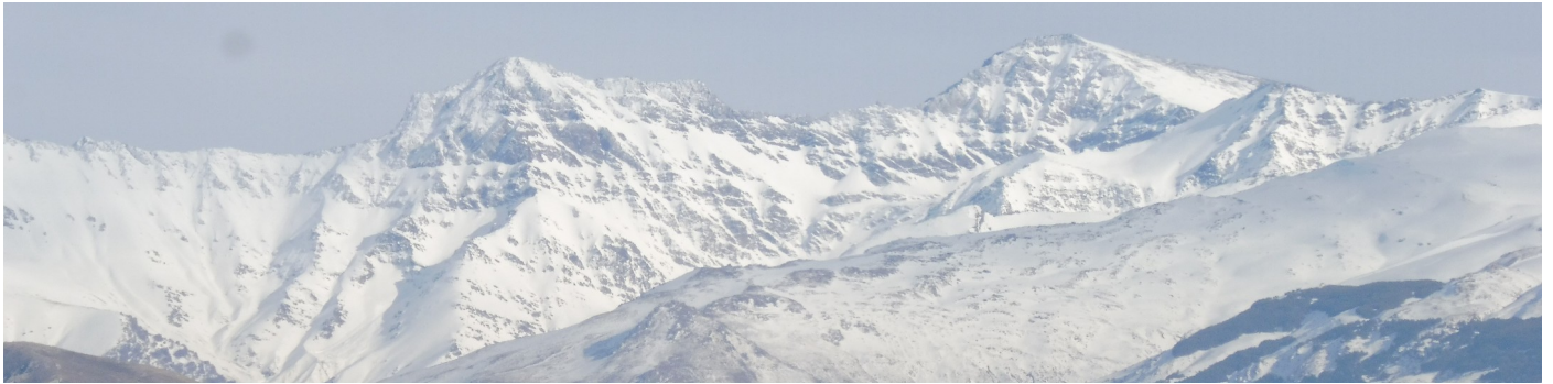
Alcazaba, Mulhacén y Veleta 13-4-26