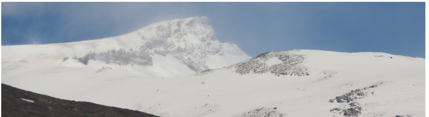
Cara sur Veleta 13-4-26