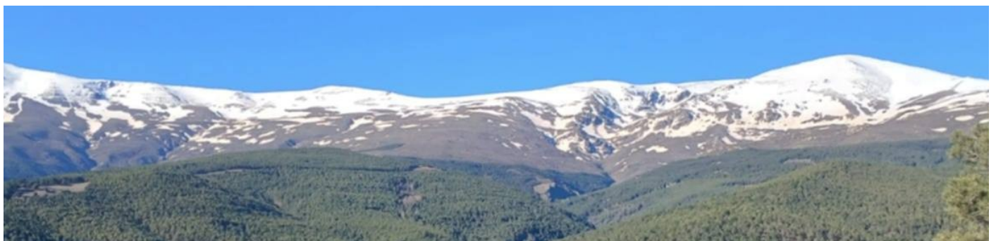
Picón de Jérez 15-4-26