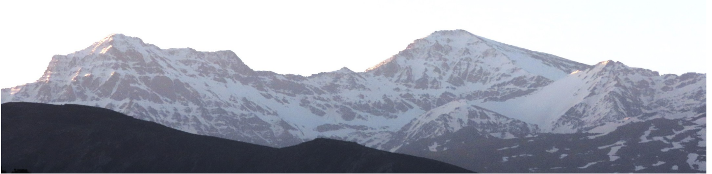
Alcazaba, Mulhacén y Veleta 28-4-26