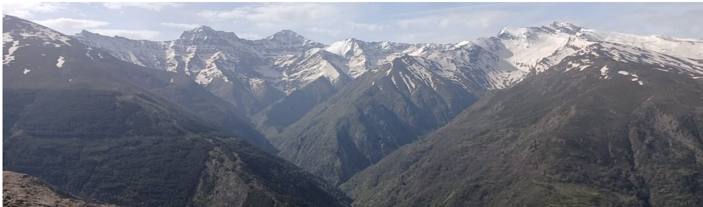
Vertiente norte Alcazaba, Mulhacén y Veleta 23-4-26