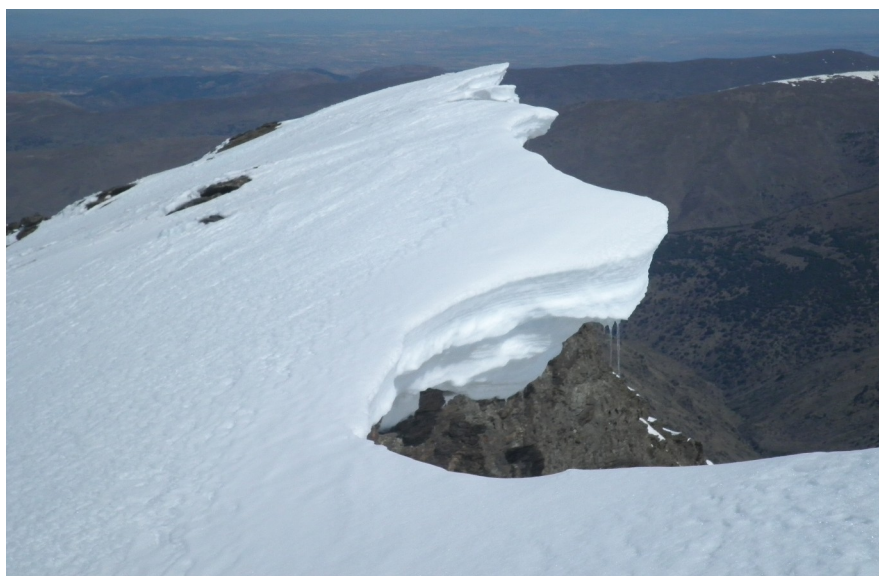
Riesgo muy alto de desprendimientos de nieve y rocas, mucha precaución.

Información sobre el riesgo de aludes en el siguiente enlace (no oficial):