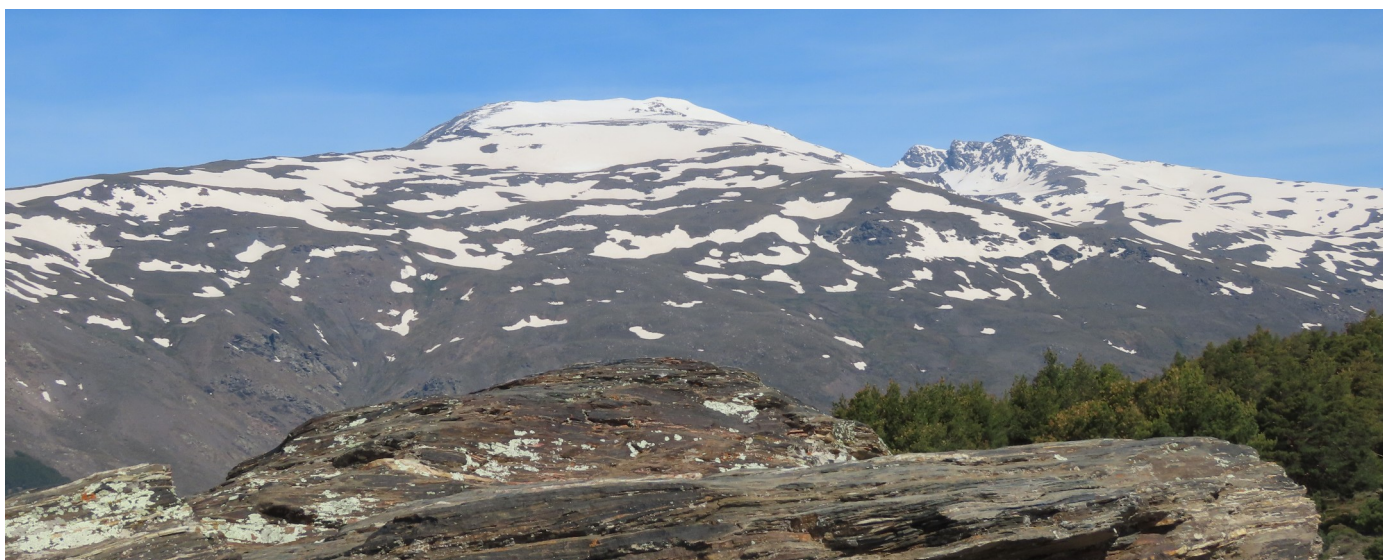
Vertiente sur Mulhacén y Alcazaba 20-4-26