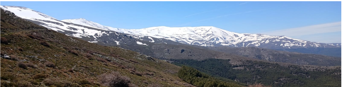
Picón de Jérez 6-4-26