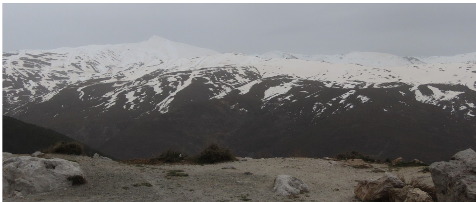
Días de poca visibilidad por la calima sahariana

Información sobre el riesgo de aludes en el siguiente enlace (no oficial):