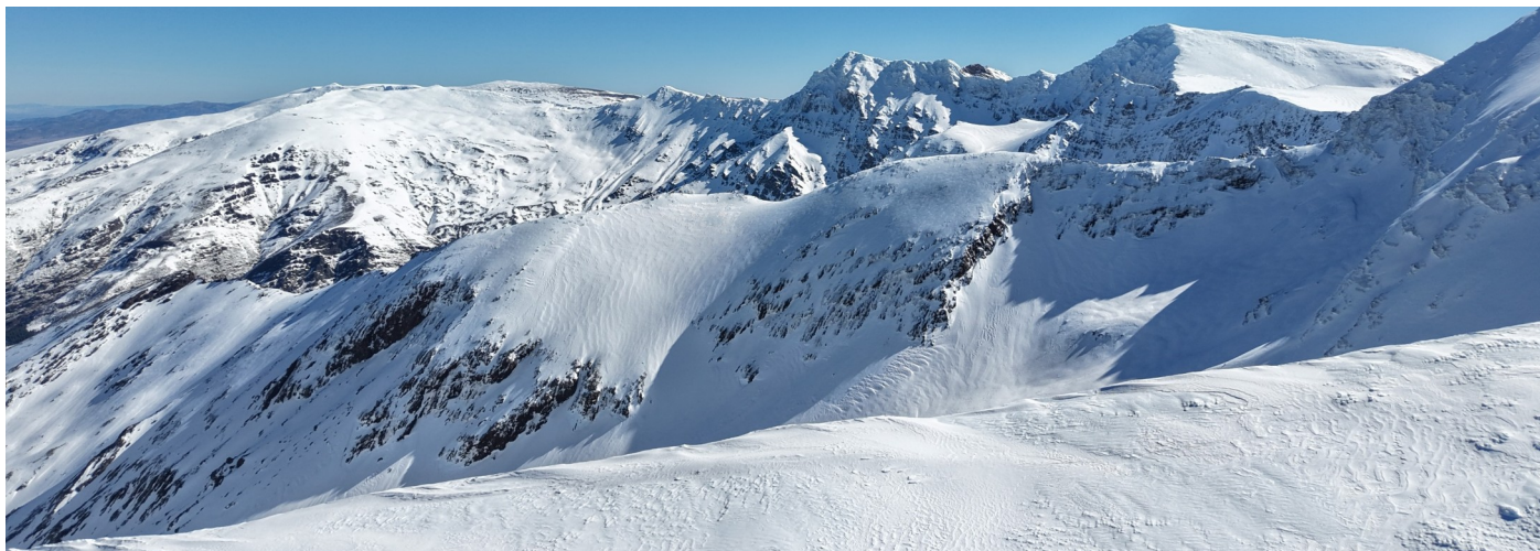
Vertiente norte 17-2-26