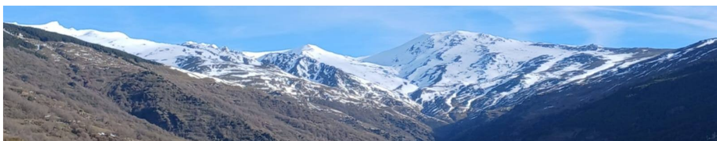
Cara sur 18-2-26