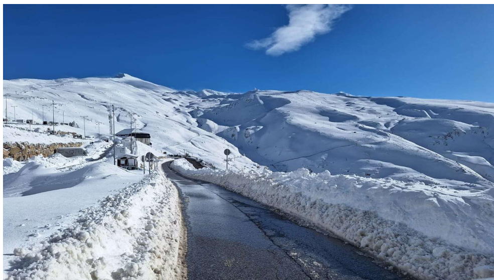
Veleta, 10-2-26.