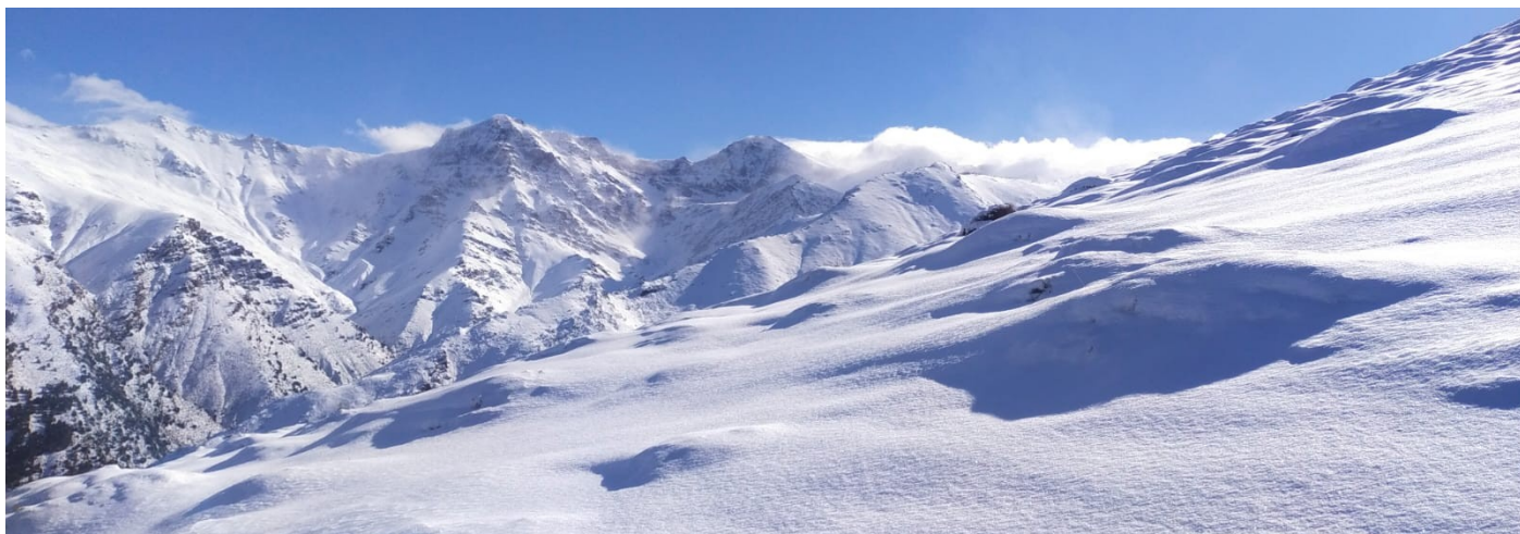
Cabecera del Genil 29-12-25