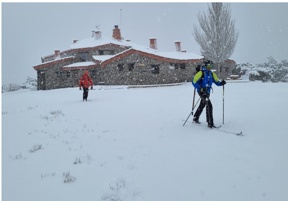
Condiciones de alta montaña invernal en toda Sierra Nevada. del día 28