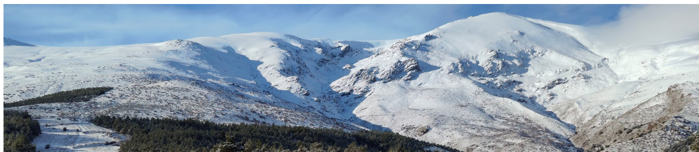
Picón de Jérez 27-12-25