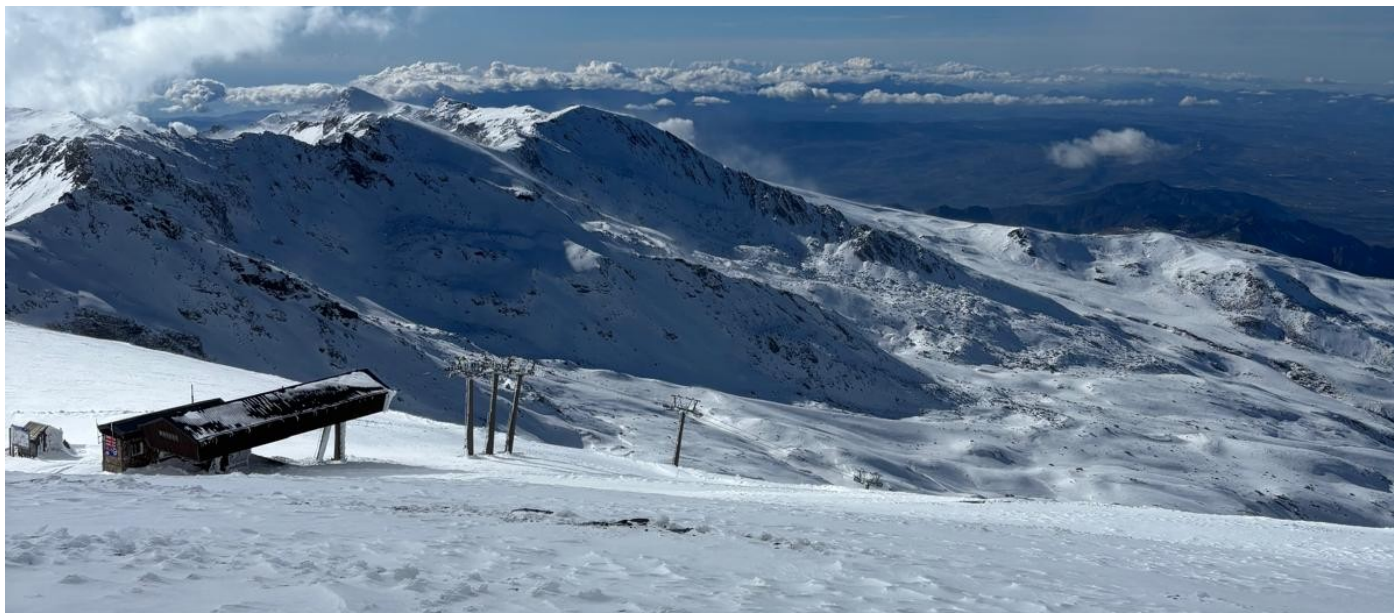
Tajos de la Virgen, Veleta y río Monachil 17-12-25