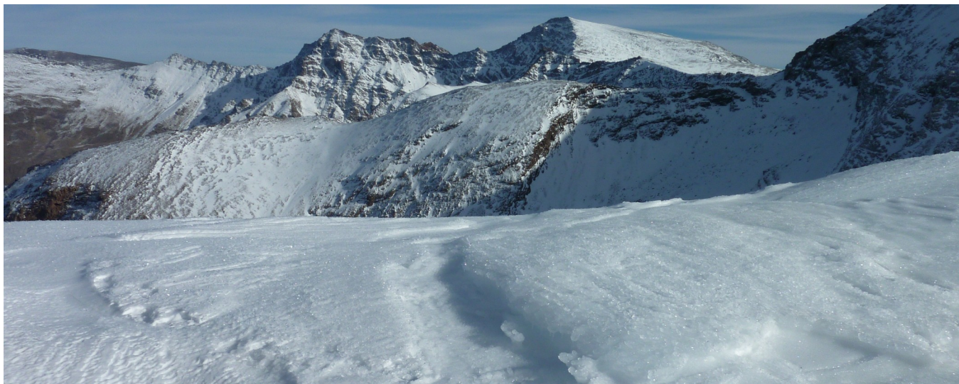
Vertiente norte 9-12-25