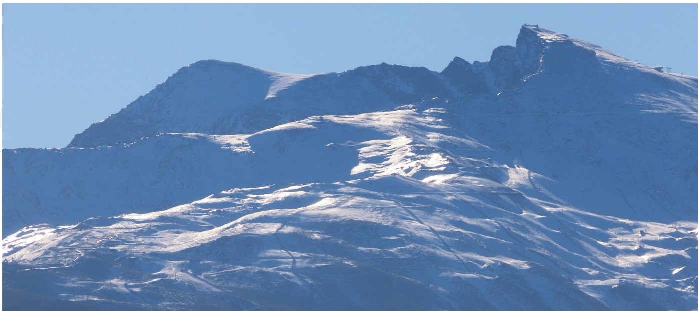
Vertiente norte Veleta, Alcazaba y Mulhacén 2-12-25 (ahora tienen más nieve)