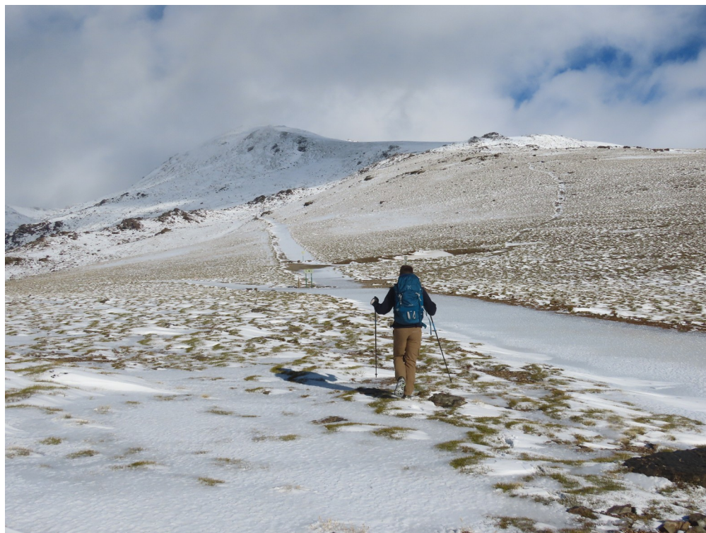
Mulhacén cara sur, 17-11-25