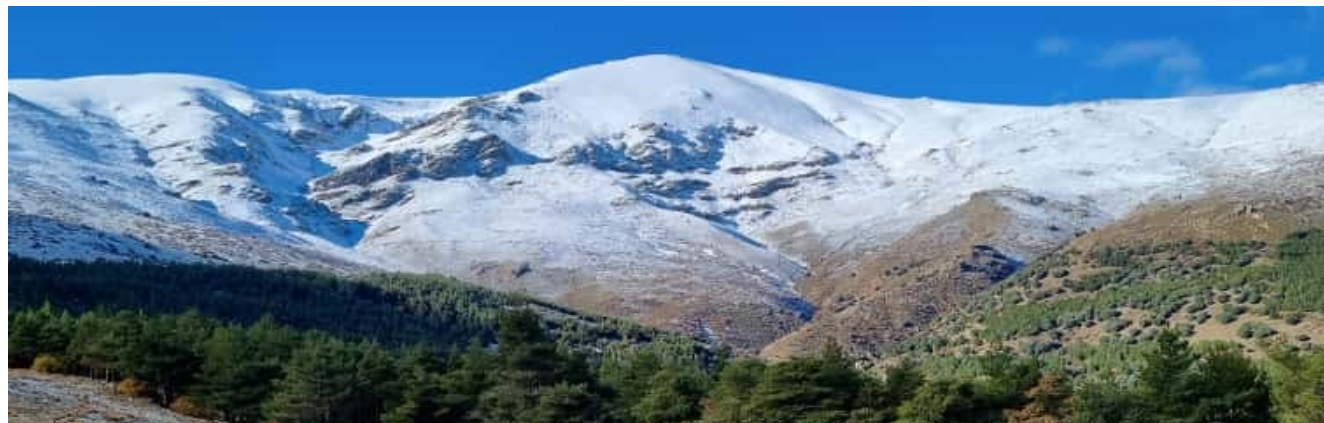
Picón de Jérez y Vertiente norte almeriense 18-11-25