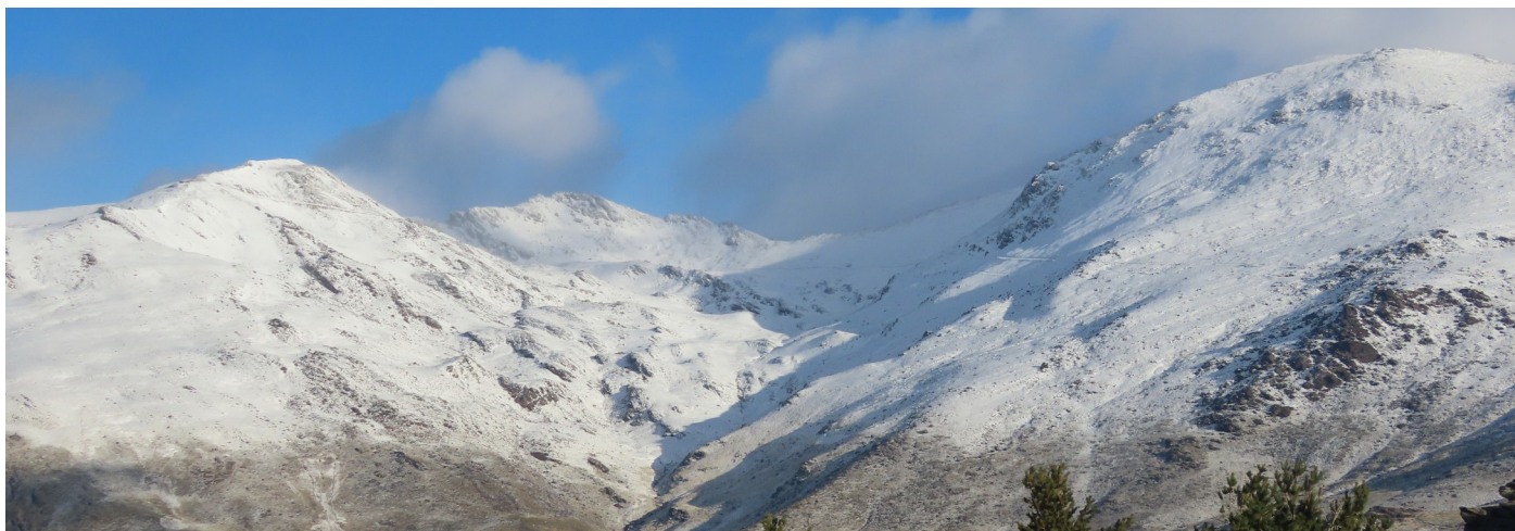
Mulhacén y Veleta cara sur 18-11-25