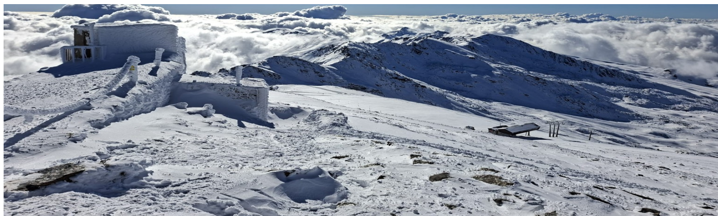
Tajos de la Virgen 18-11-25