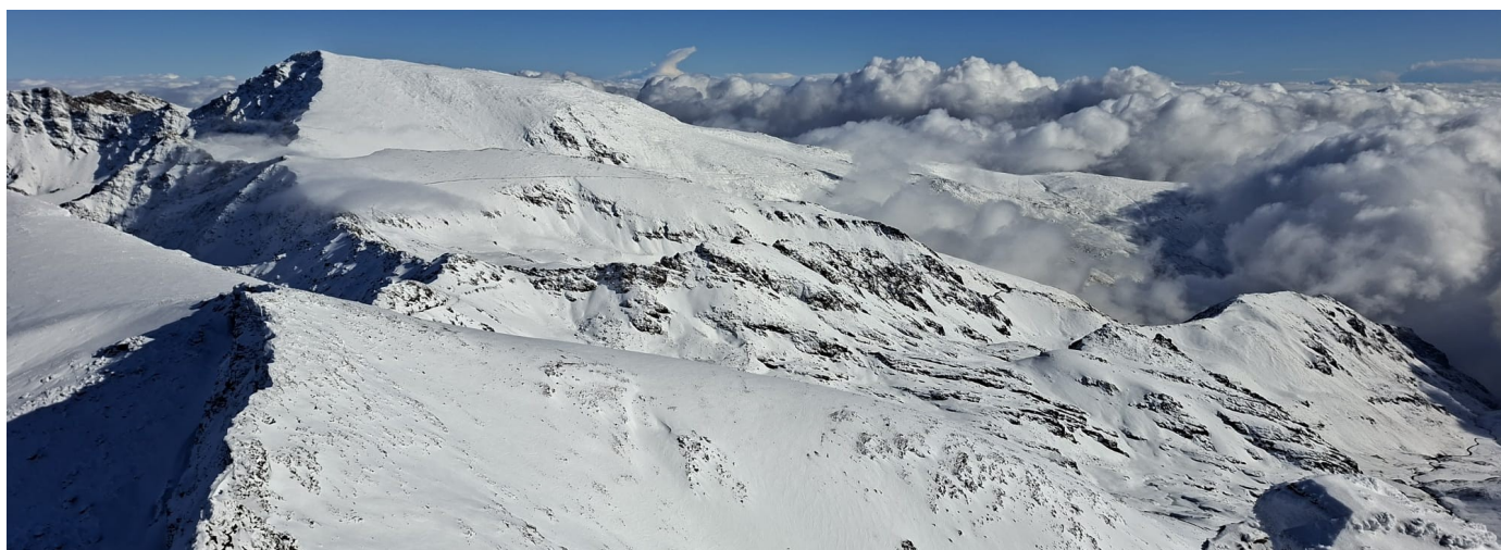
Cara sur desde la cumbre del Veleta 18-11-25