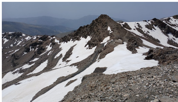
Corral y Carihuela del Veleta 11-6-25