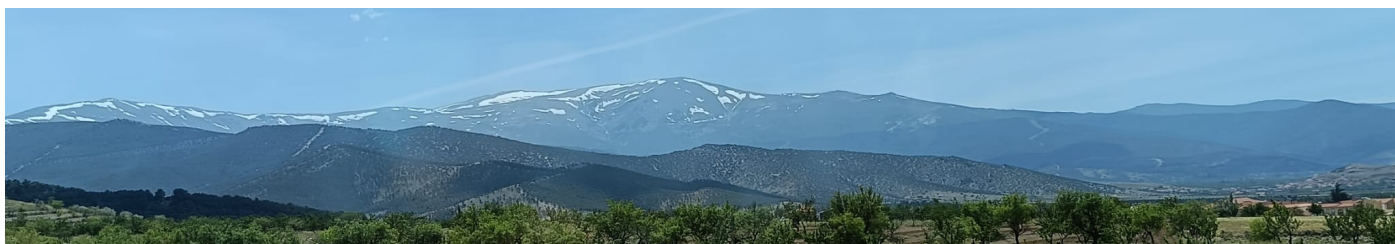
Picón de Jerez 9-6-25