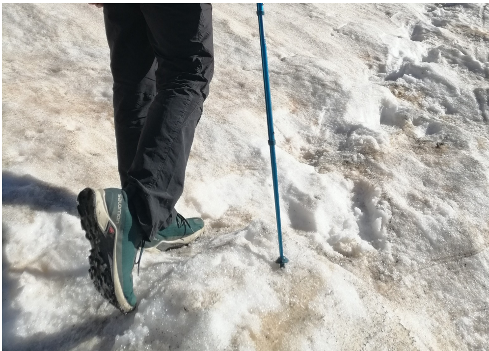
El uso de crampones es imprescindible a la hora de cruzar ventisqueros