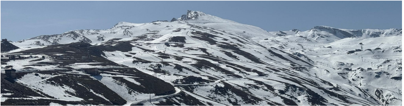
Veleta y Alcazaba 13-4-25