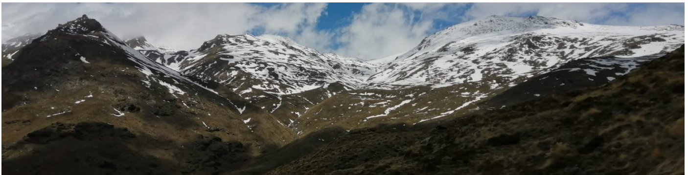
Cara sur 14-4-25