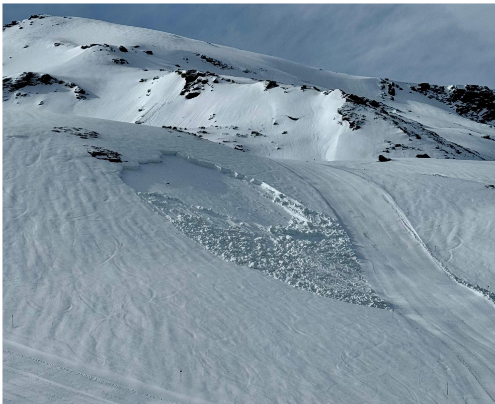
Extreme la precaución, riesgo de aludes