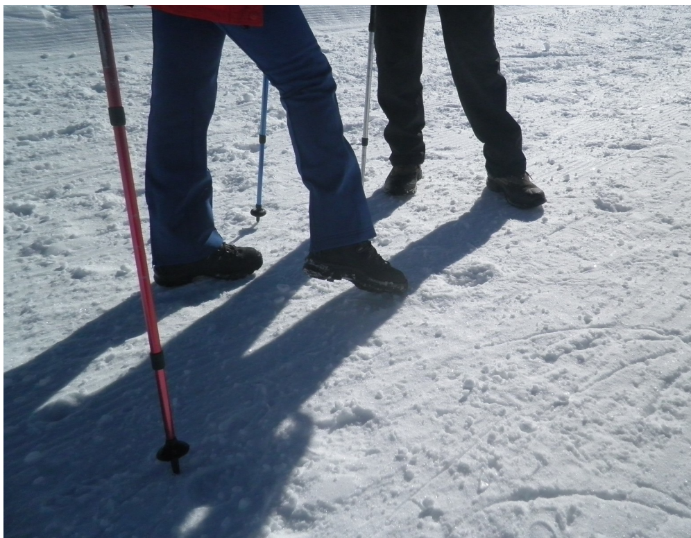
Hay poca nieve pero muy dura así que los crampones y piolets son imprescindibles