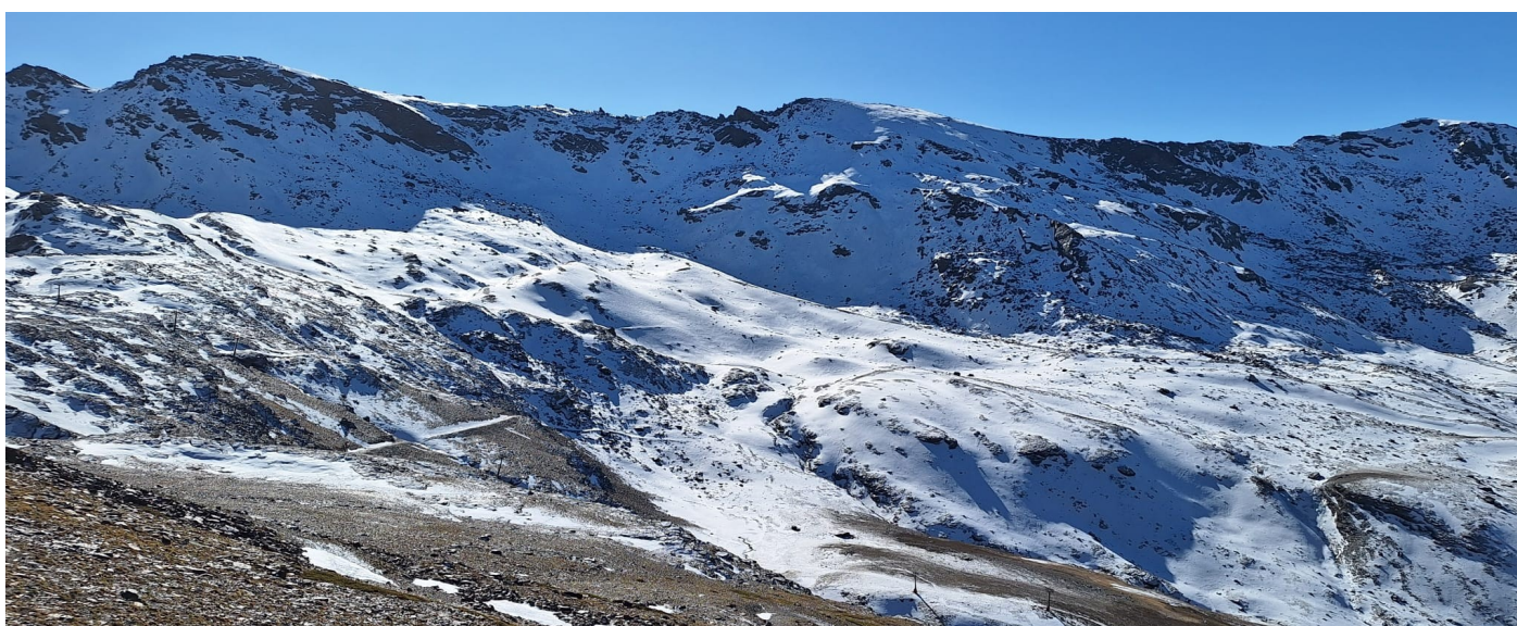
Vertiente norte Alcazaba, Mulhacén, Veleta y tajos de La Virgen 1-1-25