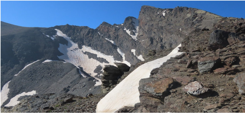
Acceso al corral del Veleta y a Elorrieta 2-7-24