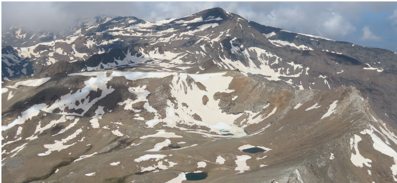
Desde la cumbre del Mulhacén 4-6-24