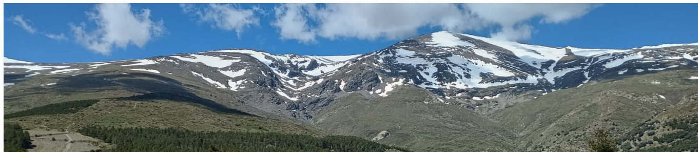
Picón de Jérez 9-5-24