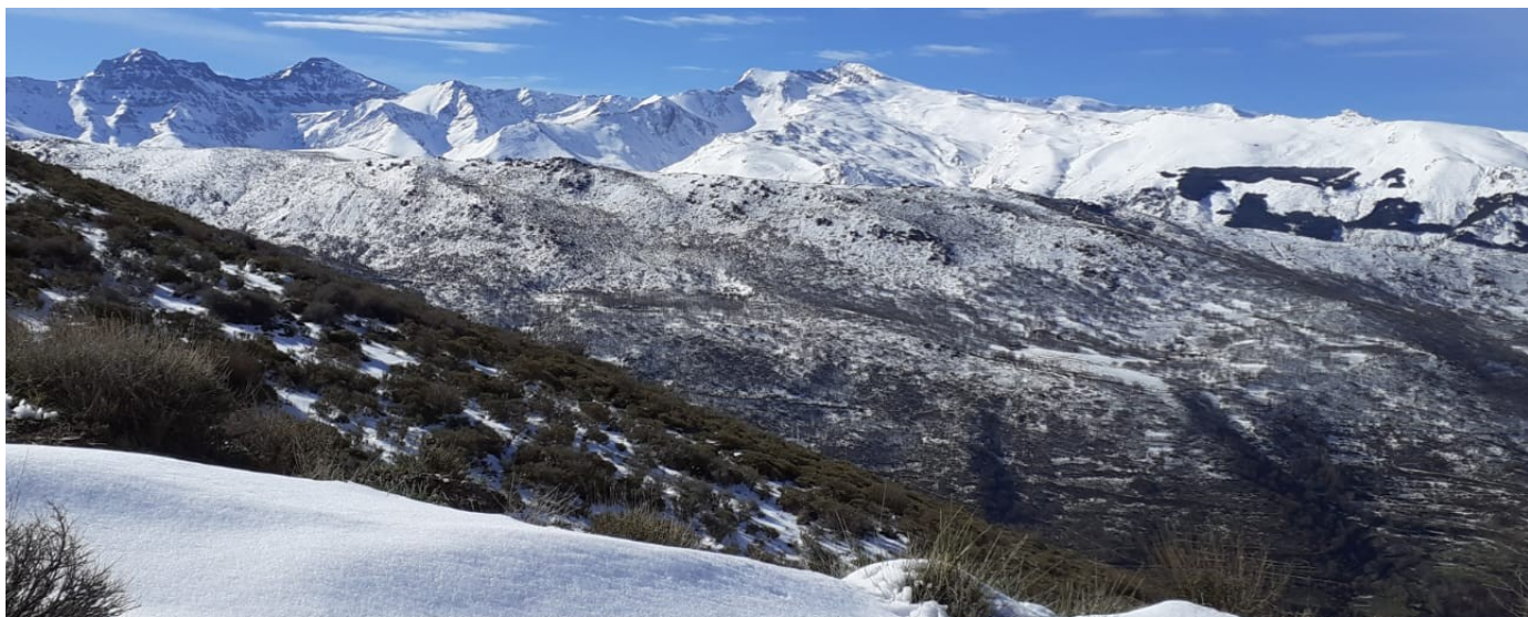
Vertiente norte desde la Alcazaba al Veleta 2-4-24