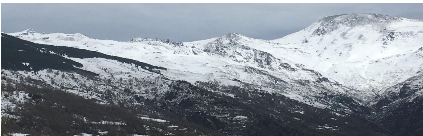
Cara sur desde el Veleta al Mulhacén 3-4-24