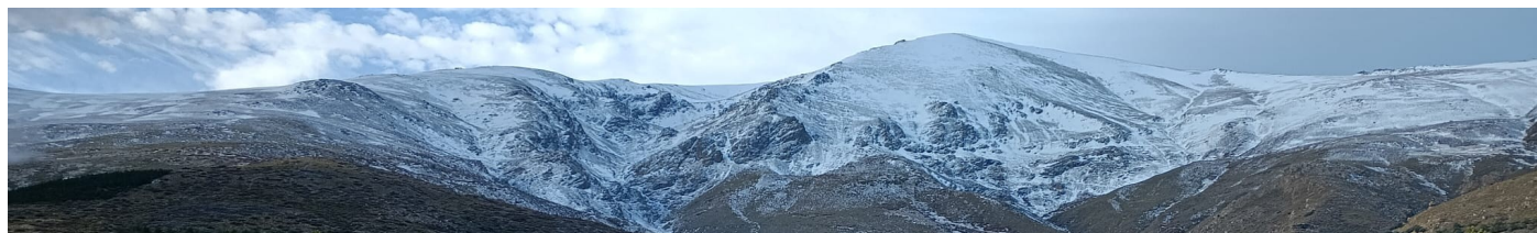
Picón de Jérez 17-1-24