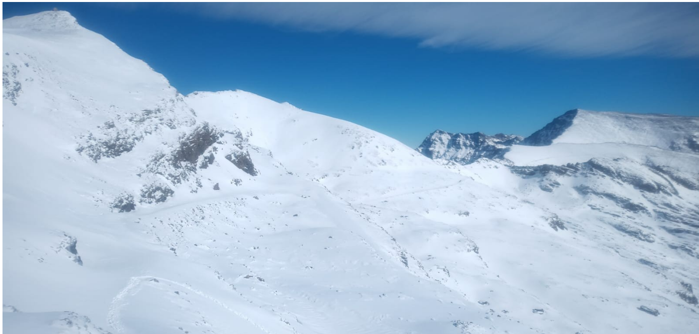
Veleta y Mulhacén desde el collado de la Carrihuela 15-1-24