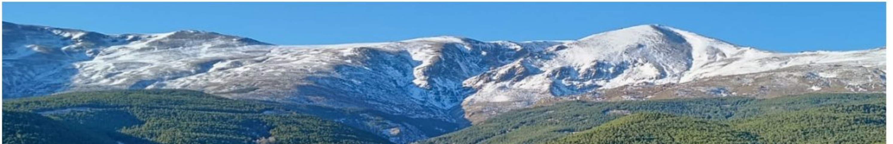
Picón de Jérez 8-1-24