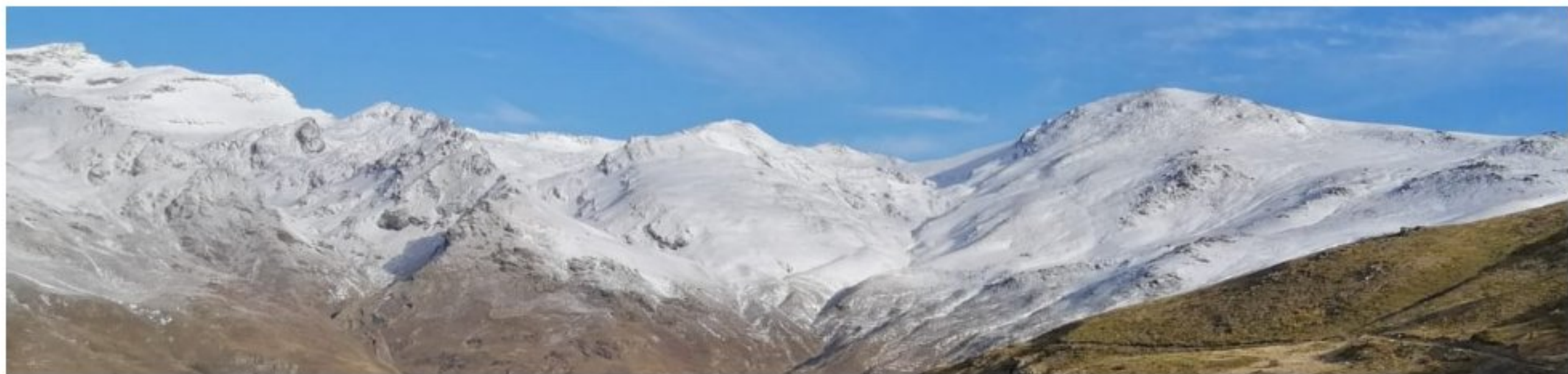
Cara sur del Veleta al Mulhacén 10-1-24