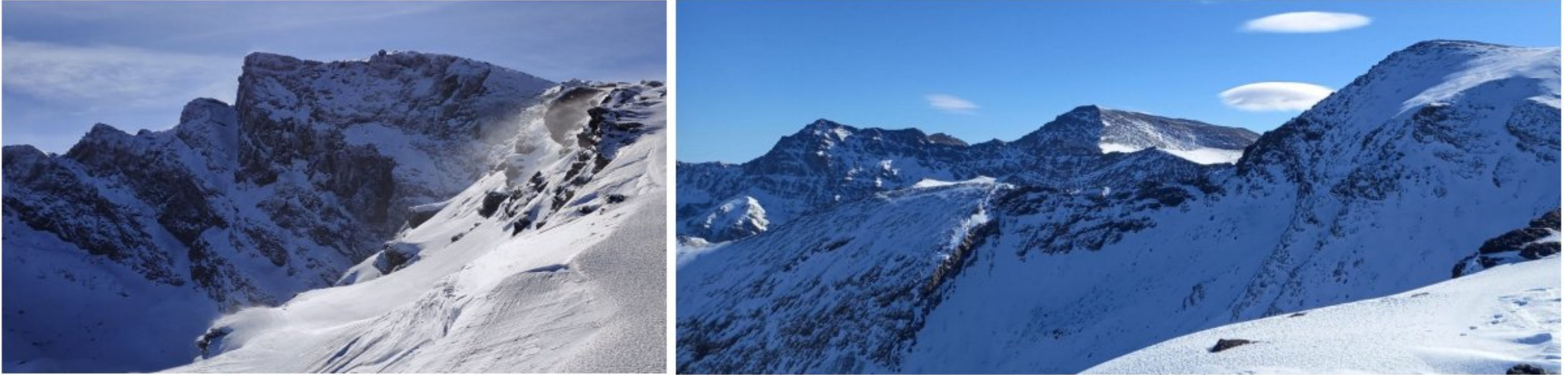
Vertiente norte 9-1-24