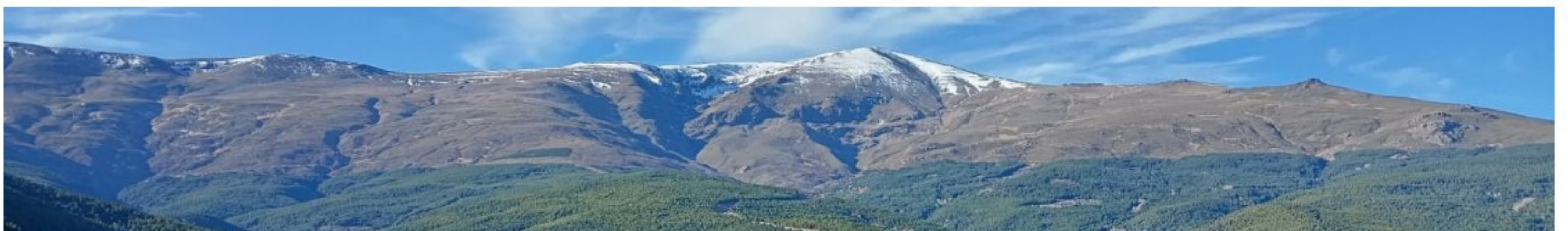
Picón de Jérez 19-12-23