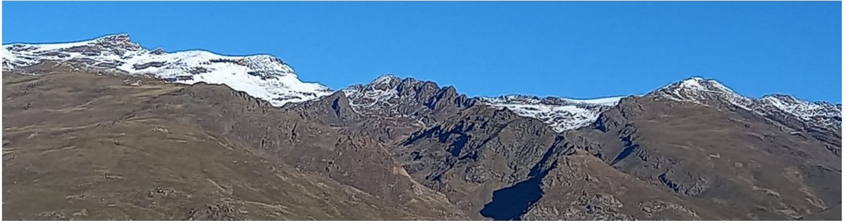
Cara sur 19-12-23