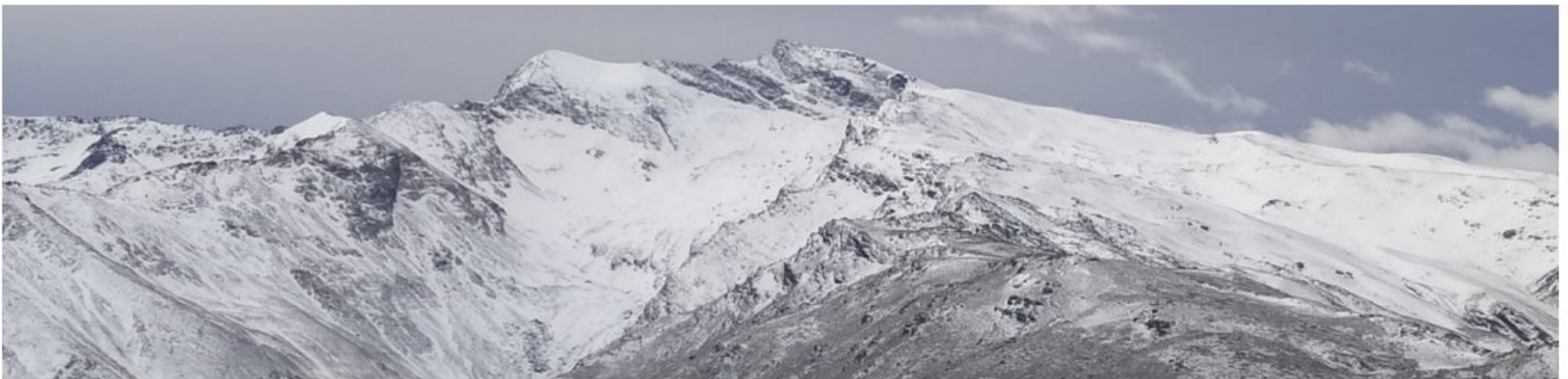
Veleta, vertiente norte 8-3-23