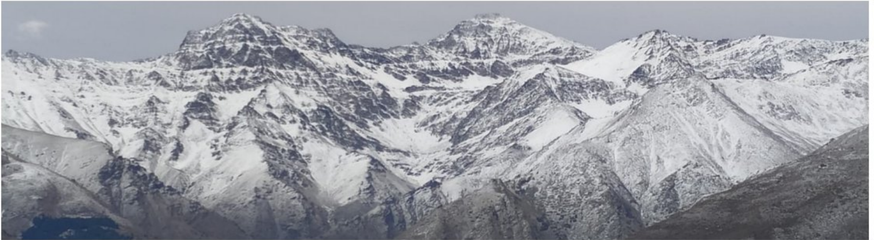
Alcazaba y Mulhacén, vertiente norte 8-3-23