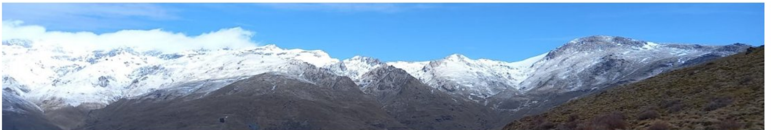
Veleta y Mulhacén, vertiente sur 8-3-23