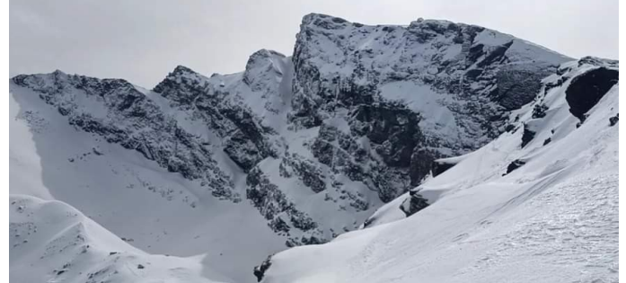
Vertiente norte de la Alcazaba a los tajos de la Virgen 19-2-23