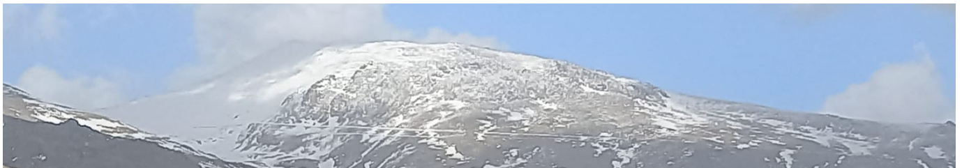
Cara sur Mulhacén 21-2-23