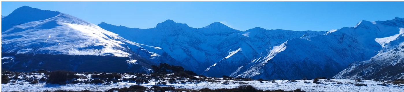
Vertiente norte y vertiente sur 31-1-23