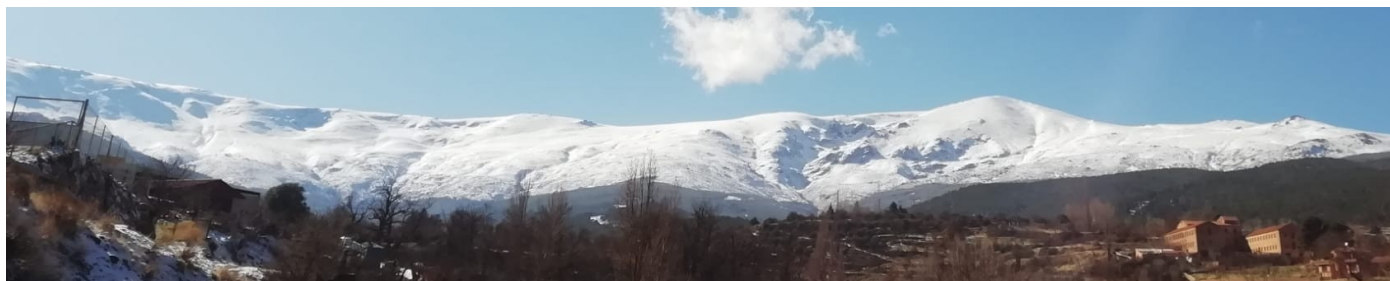
Picón de Jérez 24-1-23