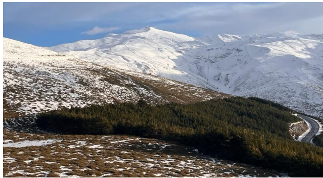
Vertiente norte 24-1-23