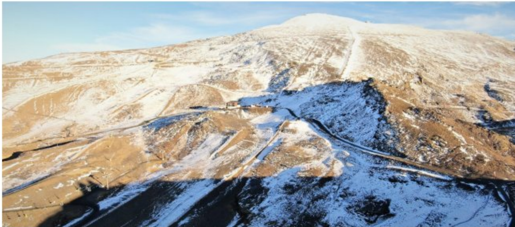
Caras oeste y sur del Veleta 29-11-22