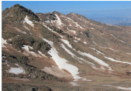
Alrededores del Veleta 1-6-22