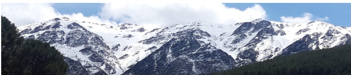
Cara norte Sierra Nevada almeriense 26-4-22