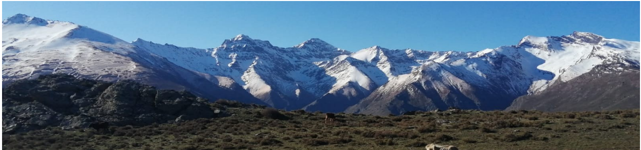
Vertiente norte 19-4-22