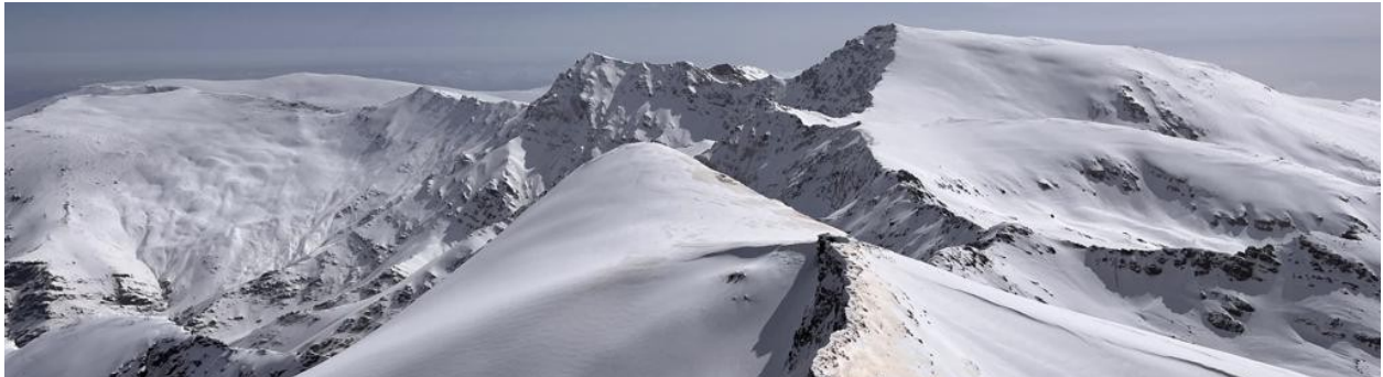
Desde la cumbre del Veleta 28-3-22