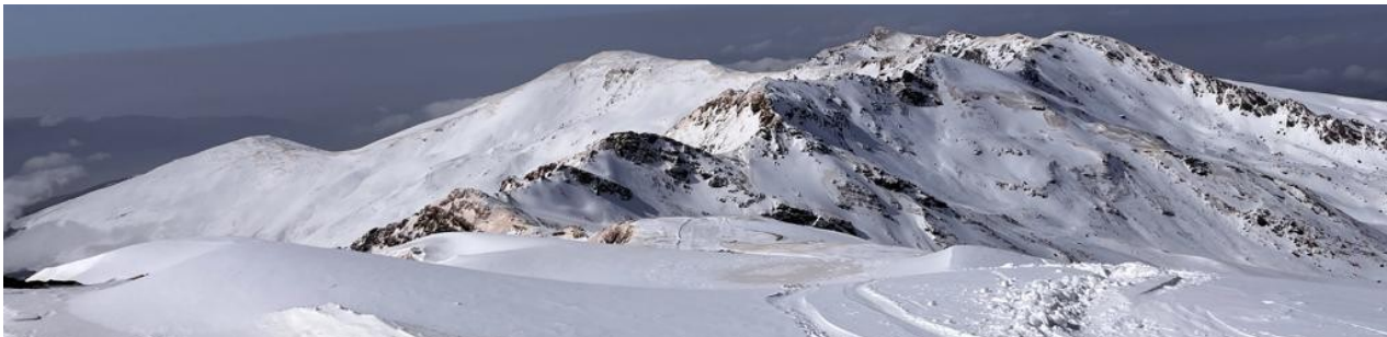
Tajos de la Virgen, Cartujo y Caballo 28-3-22