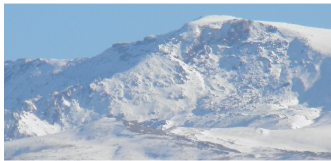
Tajos de la Virgen y Cartujo 11-1-22