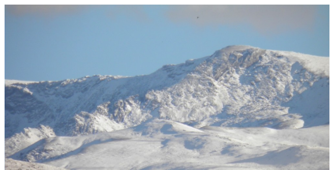
Veleta , Cartujo y Caballo 24-11-21