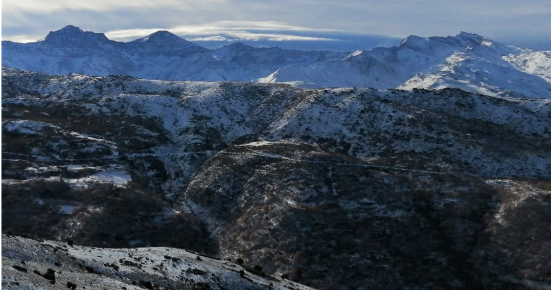
De la Alcazaba al Veleta 24-11-21