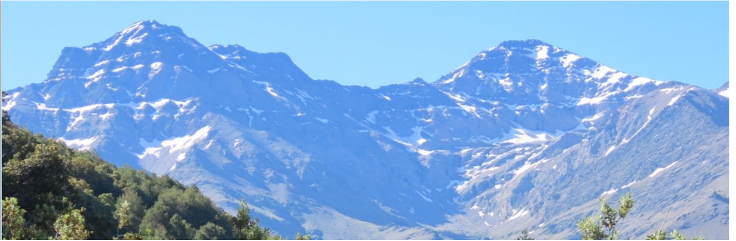
Alcazaba, Mulhacén, Cerro de Los Machos y Veleta 7-6-21