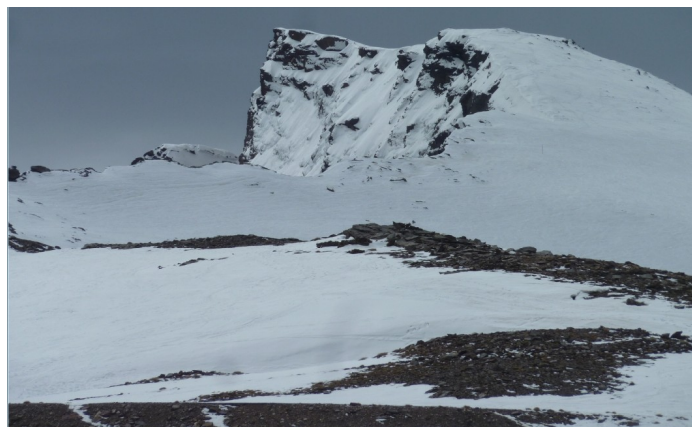
Desde las posiciones del Veleta 21-4-21