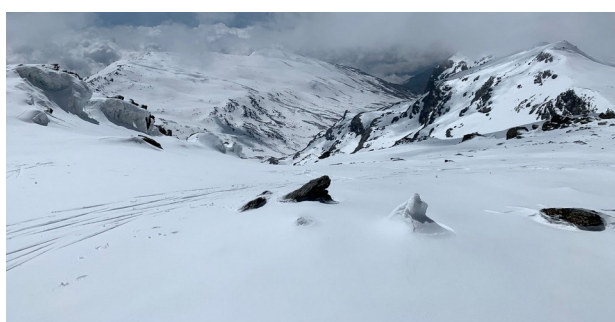
Cartujo y cabecera río Lanjarón 20-4-21