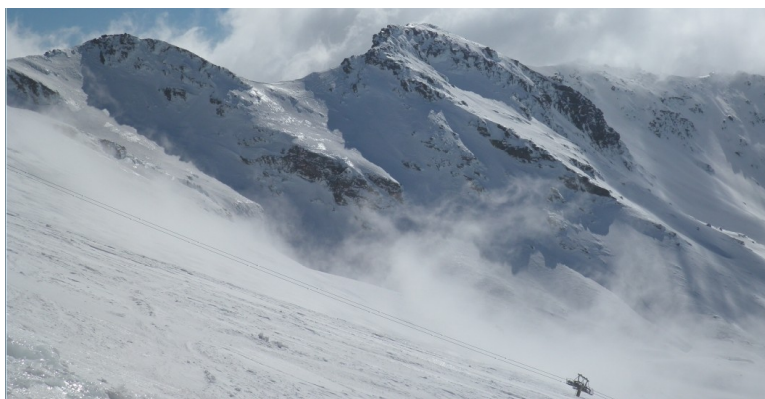
Corral del Veleta y tajos de La Virgen 10-3-21