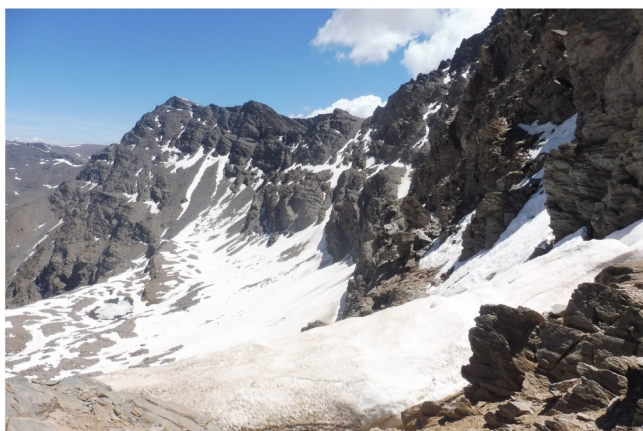
Lagunas de la Caldera y de la Mosca 29 -5 -19