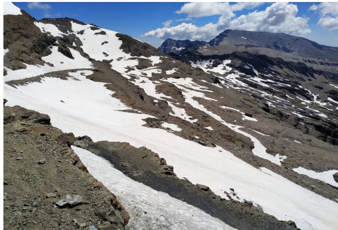
Corral y Carihuela del Veleta 29 -5-19