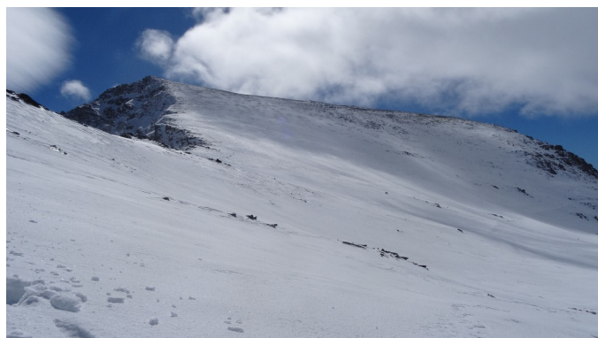
Alcazaba y Mulhacén 24 - 4 -19