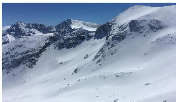
Cabecera río San Juan y Guarnón 24 -4 -19