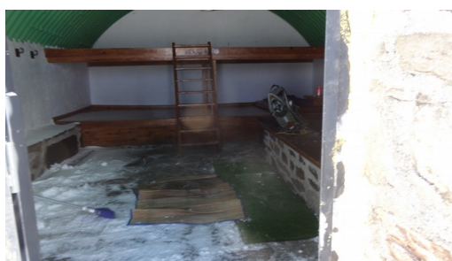
Nieve en el interior del refugio de La Caldera, increíble que todavía haya quien se deje la puerta abierta 24 -4 -19