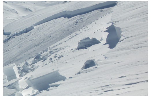
Aristas, puentes de nieve, aludes, rimayas, la sierra muy bonita pero peligrosa