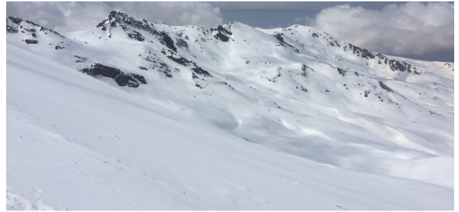
Zona del Veleta y Tajos del La Virgen 8 – 5 -18