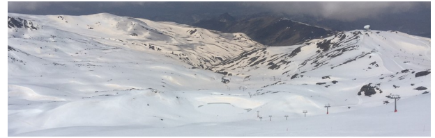
Cara sur y cara oeste desde La Carihuela 8 – 5 -18

¡Atención ! Riesgo alto de aludes de primavera sobre todo en las horas más cálidas del día, rotura de cornisas, rimayas y puentes de nieve sobre cursos de agua. Se aconseja extremar la precaución