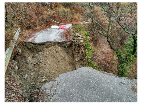
Desprendimientos en la Vereda de la Estrella y corte carretera Hotel del Duque 21-3 -18