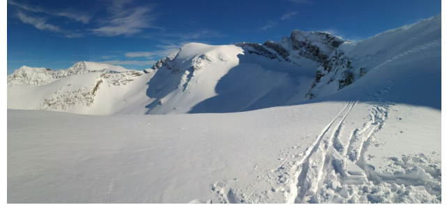
Vertientes norte y oeste desde la Alcazaba al Caballo 21 -3 -18