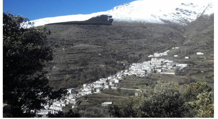
Cañada de 7 Lagunas y cabecera río Trevélez 21-3 -18