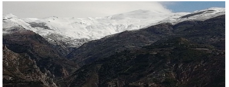
Picón de Jéres y Cerro del Caballo 21-3 -18