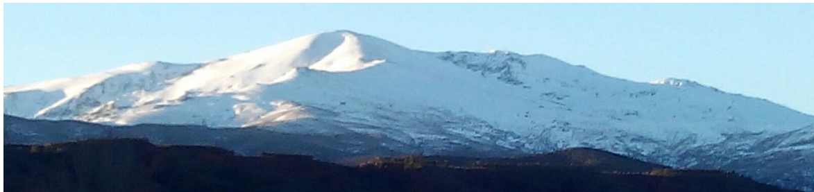
Picón de Jerez 17-1-18