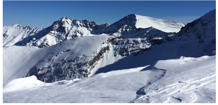
Cabecera río Genil 17-1-18