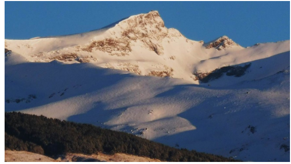
Caballo y cara sur Veleta 16-1-18