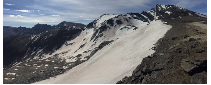
Alcazaba, Mulhacén y Veleta 16-5-17