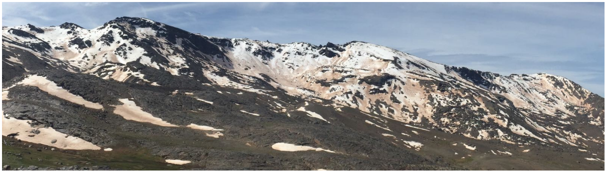
Tajos de La Virgen y Cartujo 16-5-17