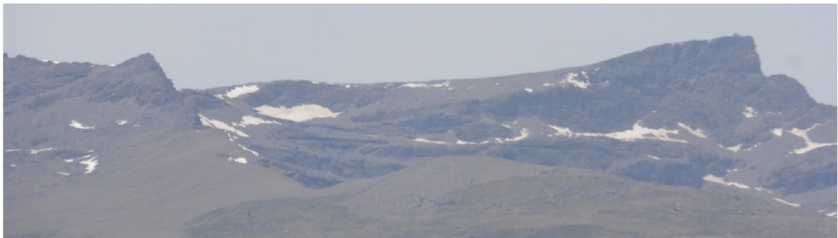
Cara sur del Veleta 16-5-17