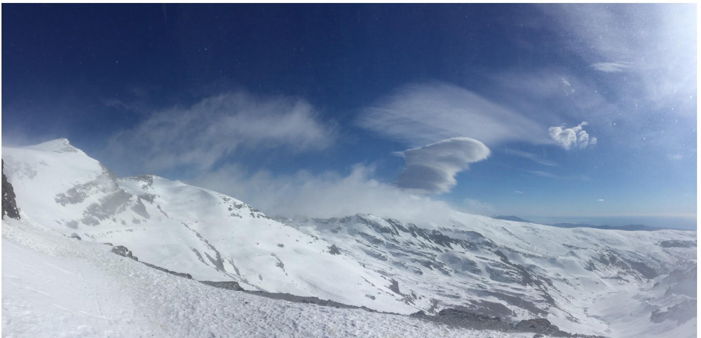
Ventisca en La Carihuela 17-1-17