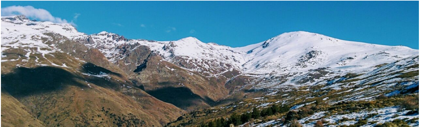
Cara sur desde el Veleta al Mulhacén 17-1-17