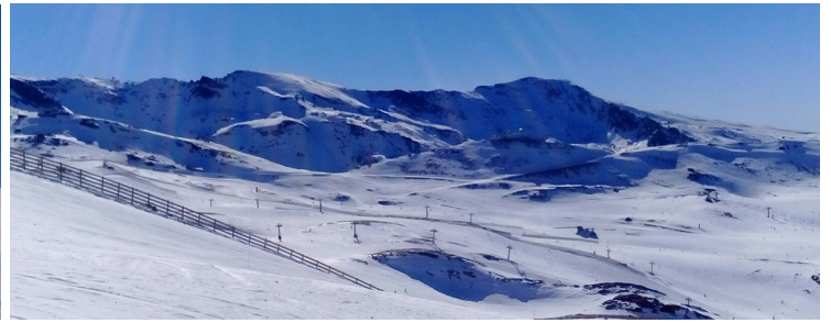
Veleta, Tajos de la Virgen y estación de esquí 17-1-17