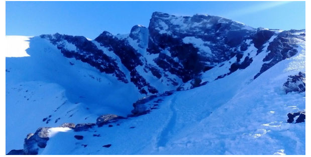
Alcazaba, Mulhacén y Veleta 17-1-17