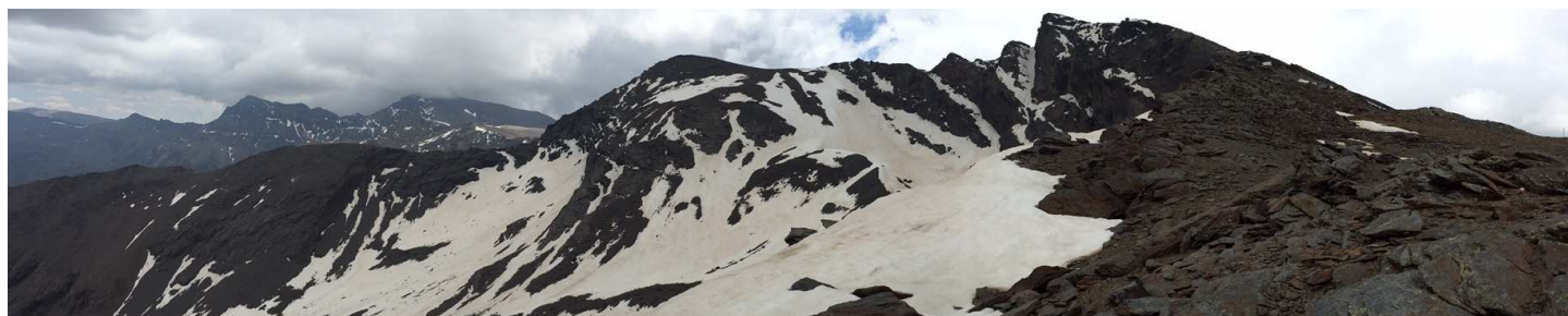
Corral del Veleta 8-6-15

- Previsiones meteorológicas de la AEMET: www.aemet.es Otras previsiones: www.meteoexploration.com , www.eltiempo.es Teletempo Sierra Nevada: 807 17 03 84 Agencia Estatal de Meteorología: 807 17 03 65 (Estos números requieren dar de alta un servicio especial en el móvil) - Refugio Poqueira: 958343349/958064111/659554224 www.refugiopoqueira.com (Webcam en directo) - Refugio Postero Alto: 616 50 60 83 / 958 06 61 10 www.refugioposteroalto.es - Centro de Visitantes Dornajo: 958 34 06 25 - Centro de Visitantes Laujar: 950 51 35 48 - Punto de Información Pampaneira: 958 76 31 27 - Punto de Información de Capileira: 958 76 30 90 / 686 41 45 76 - Contacto de correo electrónico del Área de Uso Público del P. N. Sierra Nevada: usopublico.sn.cmaot@juntadeandalucia.es - Ventana del Visitante Espacios Protegidos de Andalucía: http://www.ventanadelvisitante.es - Web Red de Parques Nacionales españoles: http://www.magrama.gob.es/es/red-parques-nacionales/nuestros-parques/sierra-nevada/