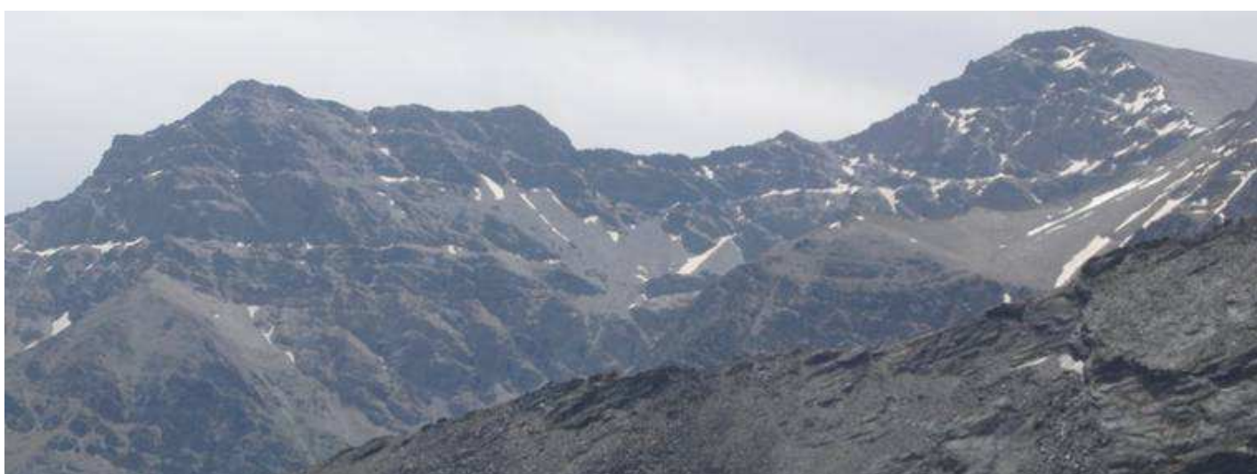
Alcazaba y Mulhacén 10-6-15