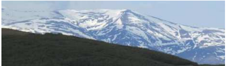
Morrón del Mediodía y Picón de Jérez 6-4-15