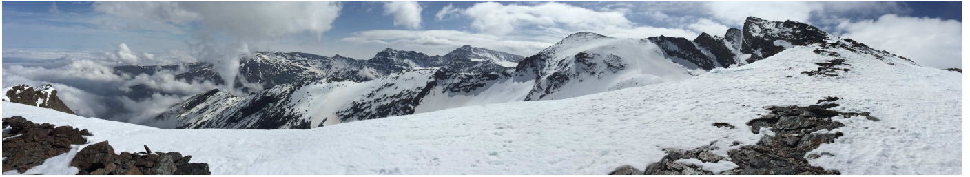
Dos perspectivas de la vertiente norte desde la Alcazaba al Veleta 7-4-15