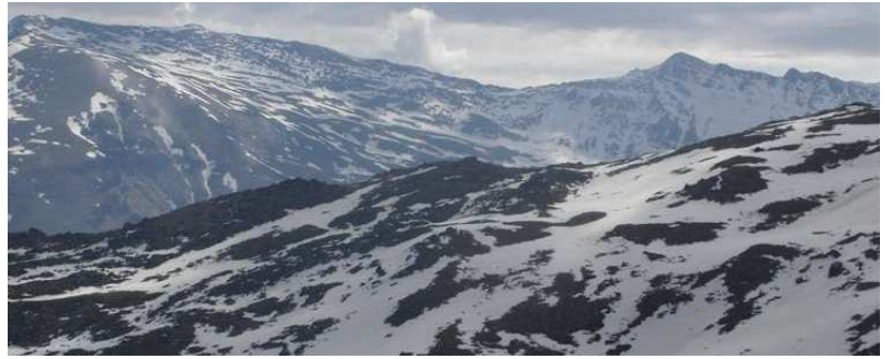
Corral del Veleta y Vacares 7-4-15