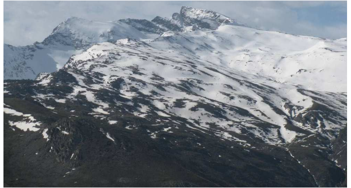
Vertiente norte desde la Alcazaba al Veleta 14-4-15