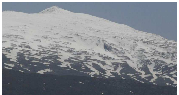
Cerro del Caballo por la vertiente sur y desde la vega de Granada 14-4-15