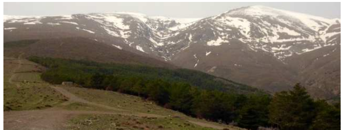
Cabecera río Alhori y Picón de Jérez 14-4-15