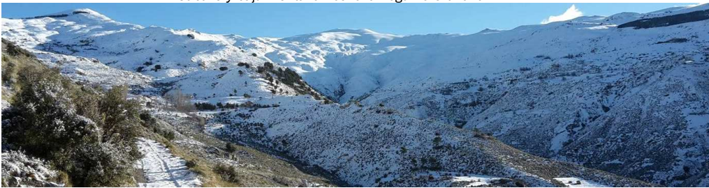
Caballo por la Rinconada de Nigüelas 20-1-15