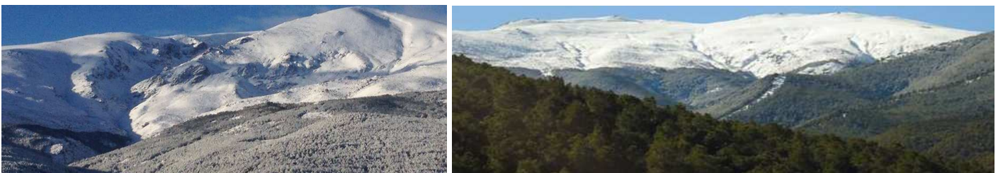
Picón de Jérez y Chullo 21-1-15