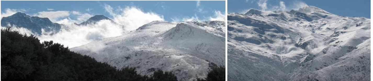
Vertiente norte: Alcazaba, Mulhacén y Veleta 19-1-15