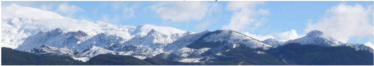
Caballo y baja montaña desde la Vega de Granada 19-1-15