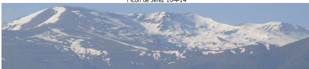
Picón de Jérez y Lavaderos de la Reina 16-4-14