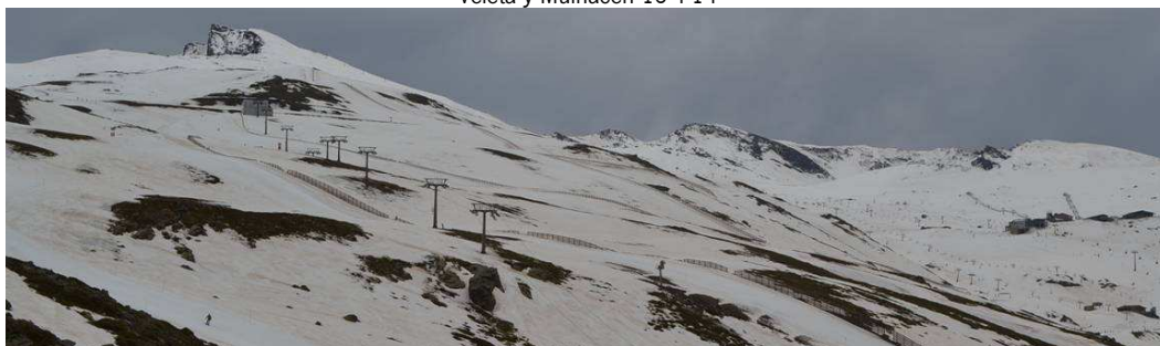
Veleta y Tajos de la Virgen 15-4-14