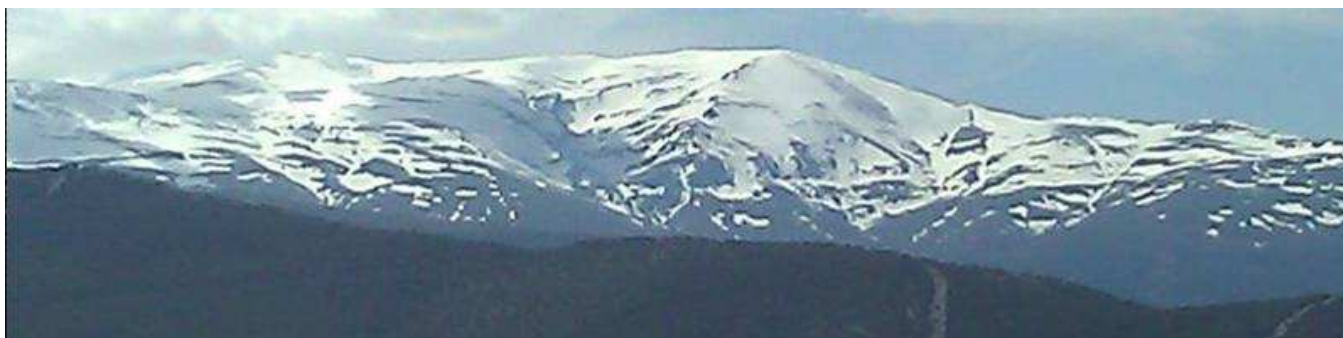
Picón de Jérez 1-4-14