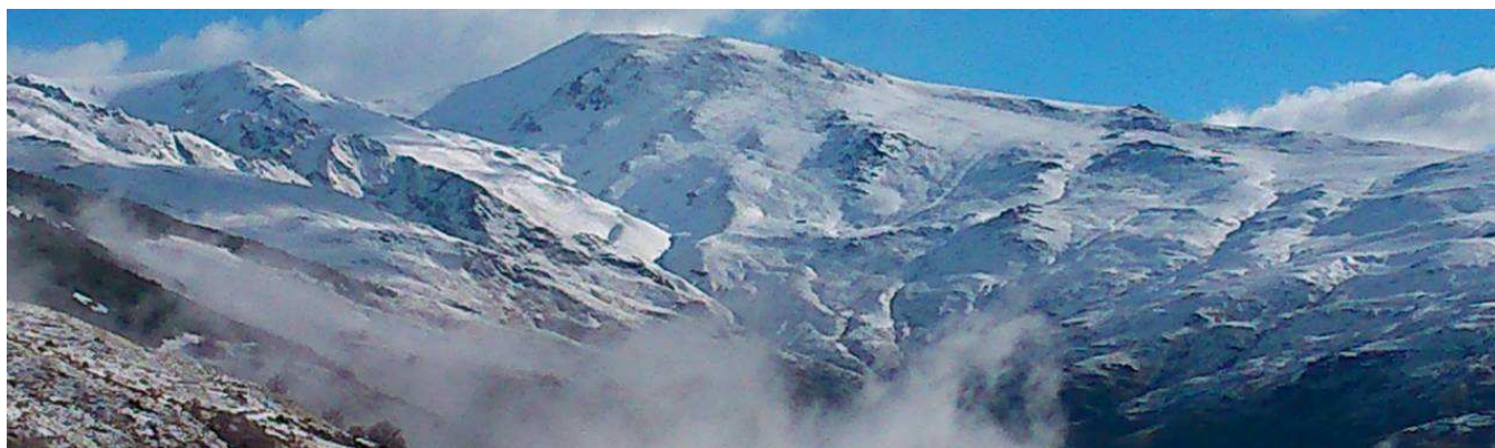
Mulhacén cara sur 3-4-14